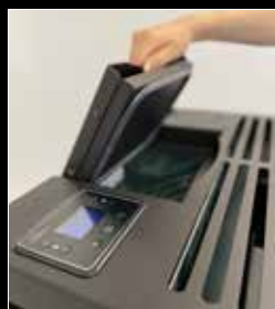
Display e serbatoio pellet