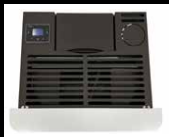
Vista parte superiore